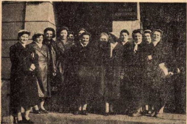
A Szakszervezetek Országos Tanácsa 1959. február 27-28-ra hívta össze a Magyar Szakszervezetek Első Nőkonferenciáját. Képünkön az első országos konferencia postás küldöttei láthatók