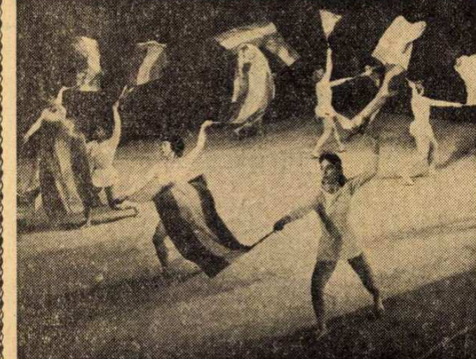
Postás tornász lányok művészi tornája az Erkel Színházban

1959 jubiláris év. Első ünnepi alkalomán — az Erkel Színházban megrendezett dísz-