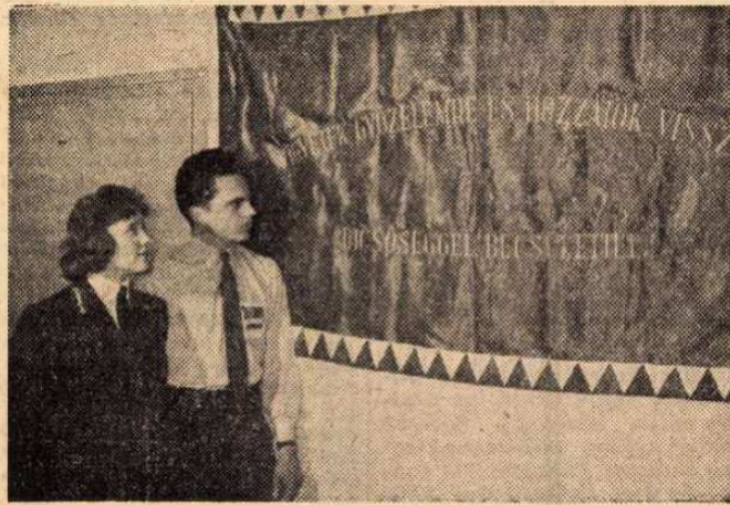
A postás szakszervezet budapesti bizottsága és a postás KISZ-szervezetek a Magyar Tanácsköztársaság kikiáltásának 40. évfordulója alkalmából ifjúsági ünnepélyt tartottak szakszervezetünk székházában 1959. március 18-án. Az ünnepségen a postás KISZ-fiatalok átvették a postás veteránoktól a Postás Vörösezred egykori csapatzászlóját