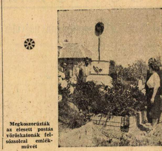
Megkoszorúzták az elesett postás vöröskatonák fel-sőszolcai emlékművét